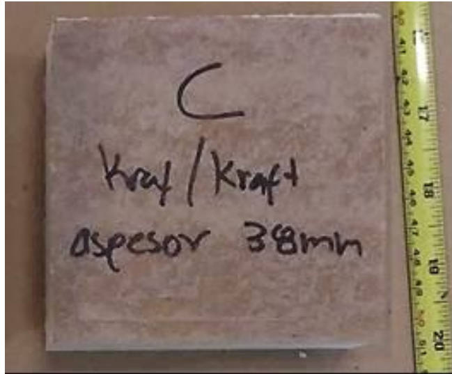
Figura 1. Probeta para el ensayo de compresión.

En la Figura 1 se presenta la muestra a analizar en su estado de entrega.