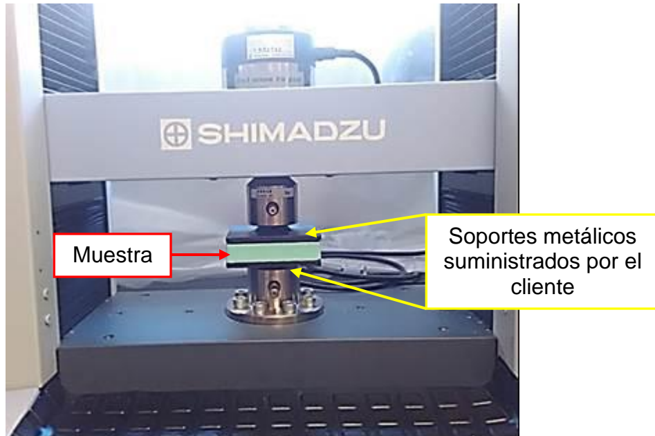
Figura 2. Montaje empleado para realizar el ensayo de compresión. Los soportes fueron suministrados por el cliente.