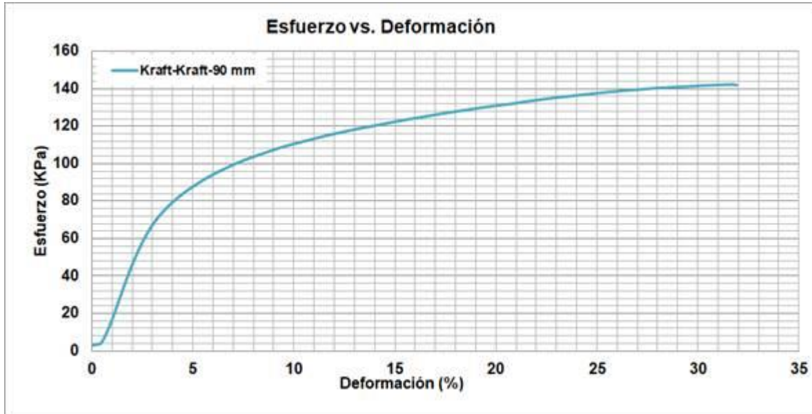
Figura 3. Curva de esfuerzo (KPa) vs. deformación (%) de la muestra de la placa de poliuretano Kraft/Kraft piso espesor 90 mm.

En la Tabla 2 se presentan los valores de fuerza en Newtons, esfuerzo en Kilo-Pascales y Mega-Pascales en el punto de cedencia (donde la curva cambia de curvatura), el módulo elástico y la velocidad de aplicación de carga. La velocidad de aplicación de carga era el 10% del espesor de la muestra por minuto, según lo que establece la norma ASTM D1621.