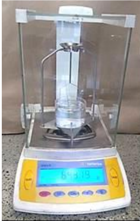
Figura 2. Kit de densidades empleado para la medición de densidad de las muestras de poliuretano / poli-isocianurato.