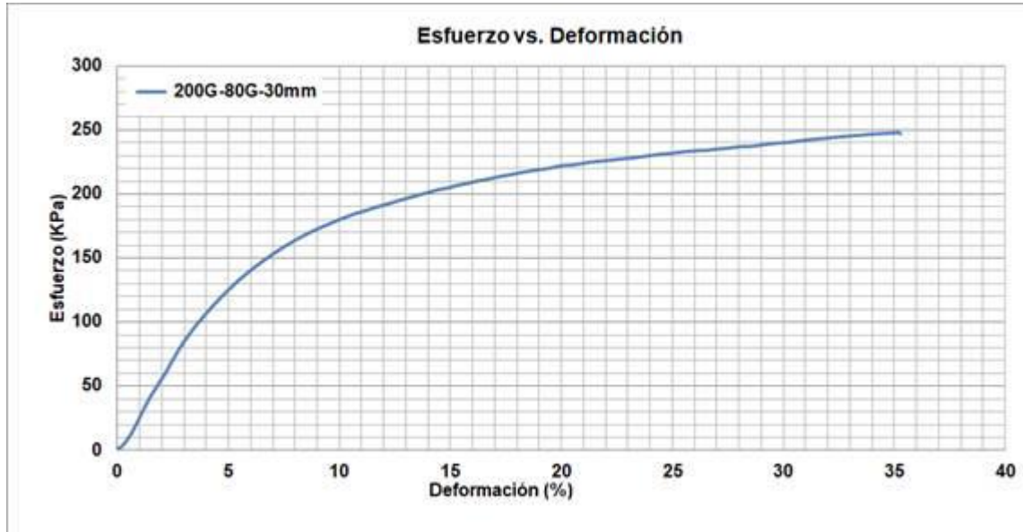
Figura 3. Curva de esfuerzo (KPa) vs. deformación (%) de la muestra de la placa de poliuretano / poli-isocianurato aluminio 200G/80G exterior espesor 30 mm.

En la Tabla 2 se presentan los valores de fuerza en Newtons, esfuerzo en Kilo-Pascales y Mega-Pascales en el punto de cedencia (donde la curva cambia de curvatura), el módulo elástico y la velocidad de aplicación de carga. La velocidad de aplicación de carga era el 10% del espesor de la muestra por minuto, según lo que establece la norma ASTM D1621.