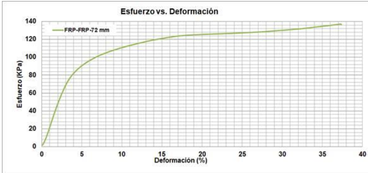
Figura 3. Curva de esfuerzo (KPa) vs. deformación (%) de la muestra de la placa de poliuretano FRP/FRP espesor 72 mm.

En la Tabla 2 se presentan los valores de fuerza en Newtons, esfuerzo en Kilo-Pascales y Mega-Pascales en el punto de cedencia (donde la curva cambia de curvatura), el módulo elástico y la velocidad de aplicación de carga. La velocidad de aplicación de carga era el 10% del espesor de la muestra por minuto, según lo que establece la norma ASTM D1621.